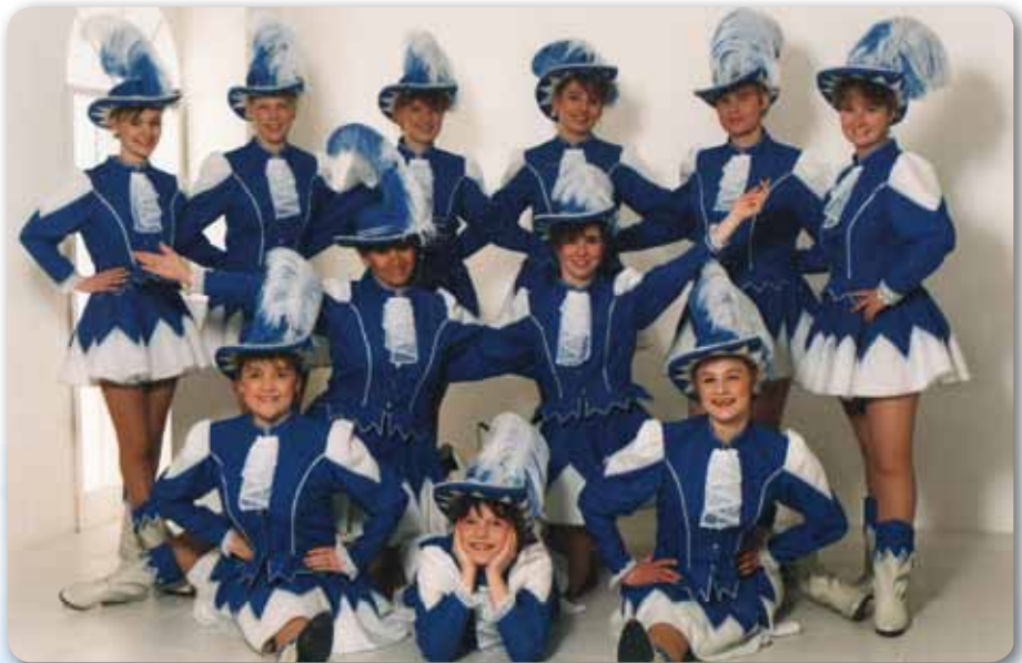
1992: Prinzengarde mit neuen Kostümen