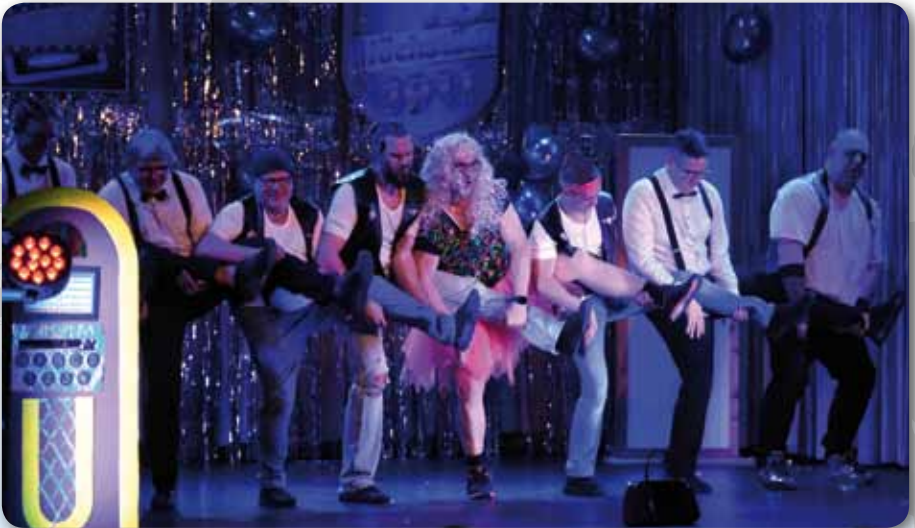
2023: Männerballett Schautanz