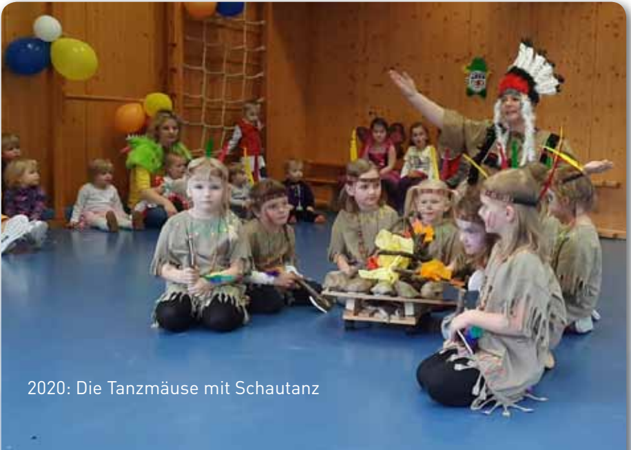
2020: Die Tanzmäuse mit Schautanz