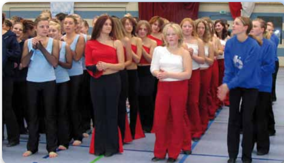
2003: Dance Devils und Dance Kids III beim Gruppenwettbewerb Dance in Buchlohe