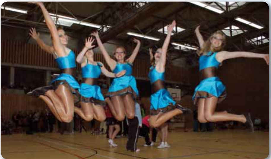
2009: Freude über den 3. Platz