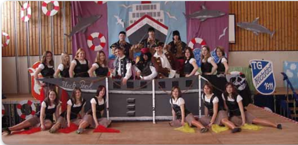
2006: Fire Dancer Schautanz FLUCH DER KARIBIK