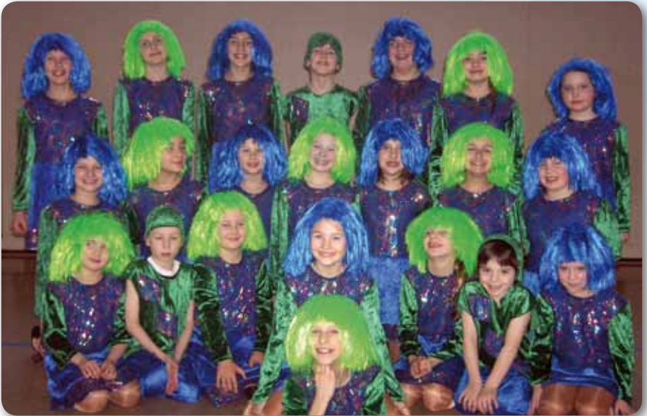
2007: Dance Kids | Schautanz Lazy Town