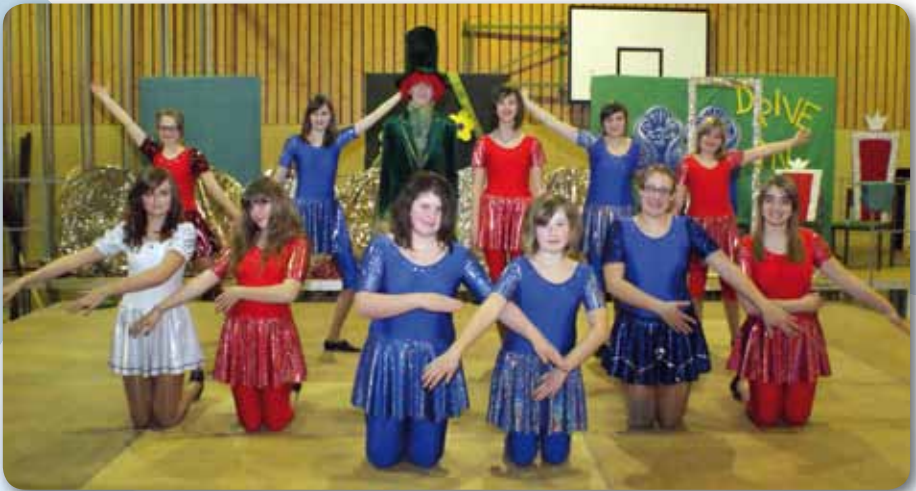
2011: Dance Kids III Schautanz