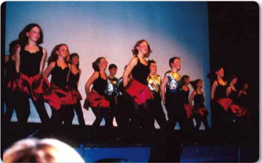
2002: Auftritt in der Glore Concert Hall in Ennis