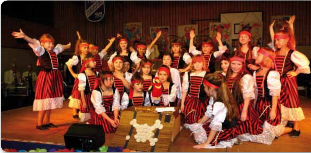
2009: Dance Kids I Schautanz