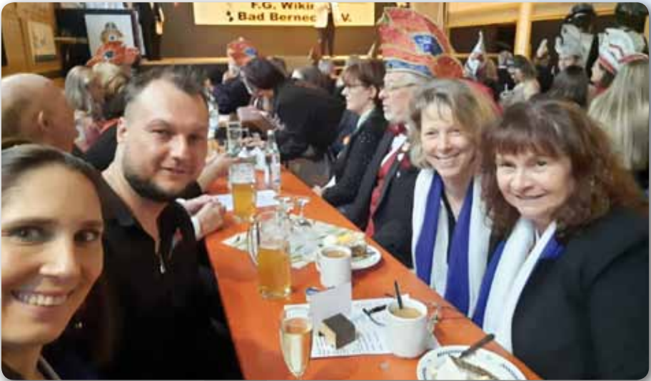
2021, November: Oberfränkische Faschingseröffnung in Bad Berneck