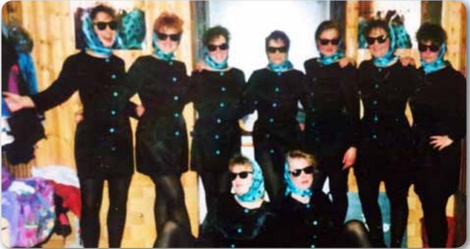
1992: Prinzengarde Schautanz KISS