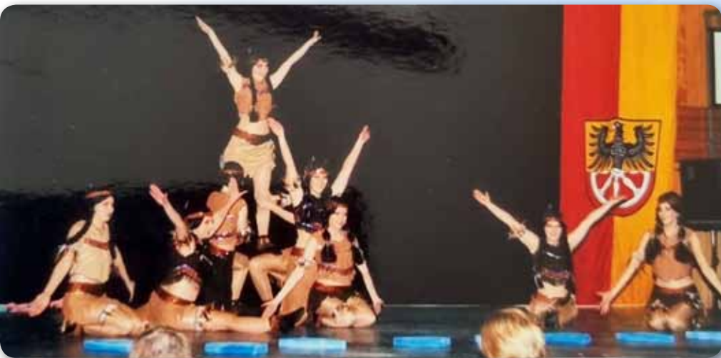
2008: Prinzengarde Schautanz INDIANER