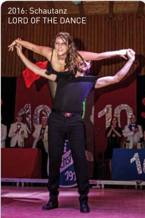
2016: Schautanz LORD OF THE DANCE