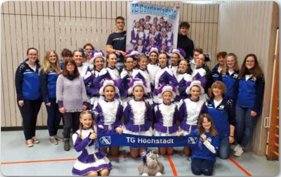
2019: Nachwuchsgarde beim Freundschaftsturnier