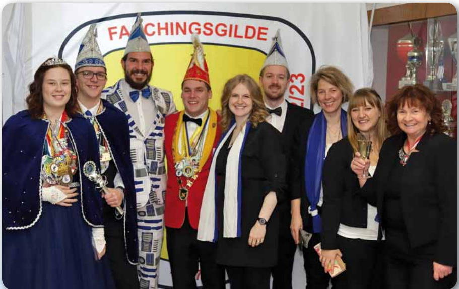
2023: Abordnung der TG beim Oberfränkischen Prinzentreffen