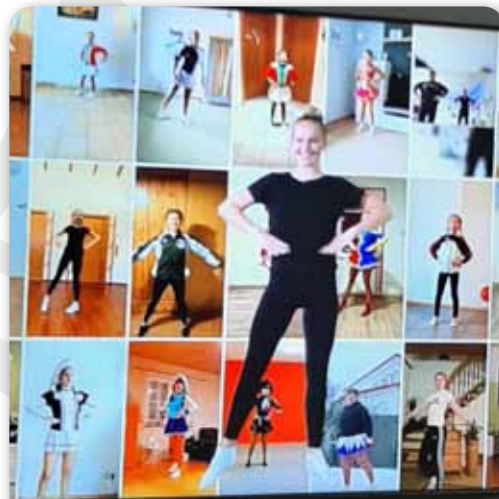
2021, Februar: Prinzengarde Online Challenge