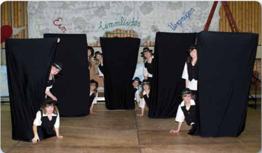
2010: Dance Kids III Schautanz POKER FACE