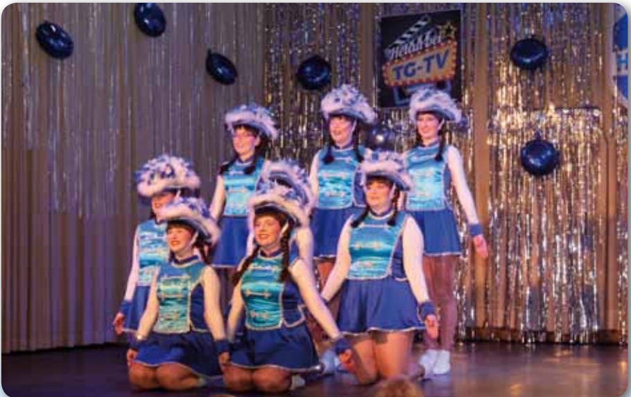
2023: Prinzengarde Galaabend TG