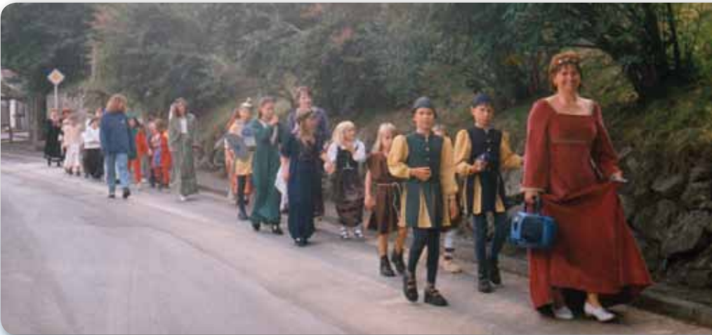
1998: 700-Jahr-Feier Höchstädt: Vom Pressetermin im Schloss zur Generalprobe an der Sparkasse