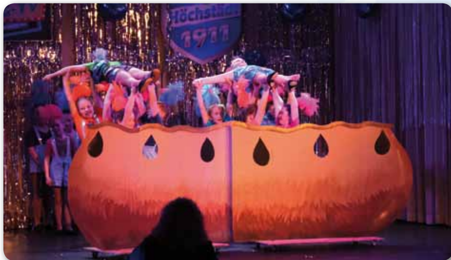
2023: Kindergarde Schautanz