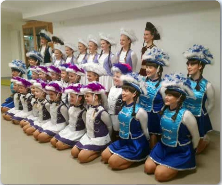
2023-11-04: Jubiläumsabend: Jubiläumsgarde (bestehend aus Kindergarde, Nachwuchsgarde und Prinzenгарde) und Solistinnen