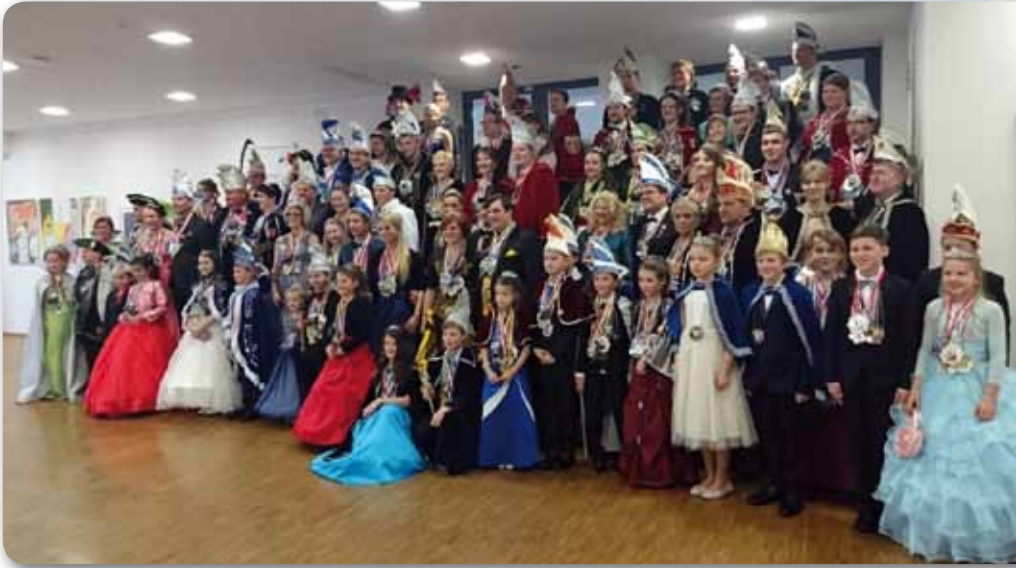
2016: Oberfränkisches Prinzentreffen in Hof