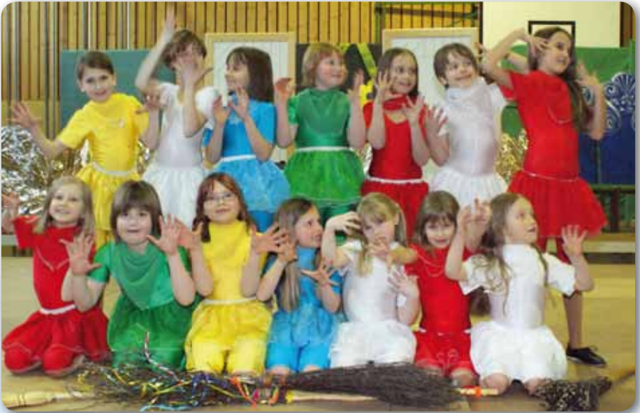
2011: Dance Kids | Schautanz