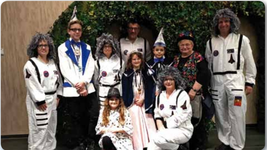
2019: Abordnung der TSA zur Fernsehsetzung „Wehe, wenn wir losgelassen“ in Veitshöchheim