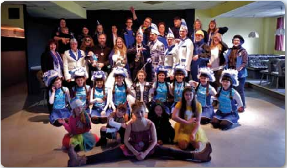
2020: Rathaus Schlüssel-Rückgabe an Bürgermeister Gerald Bauer (mit Nachwuchs)