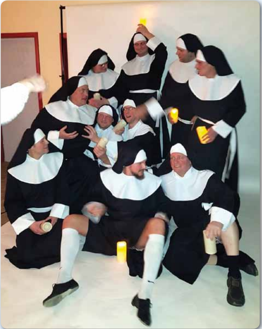
2019: Männerballett Schautanz