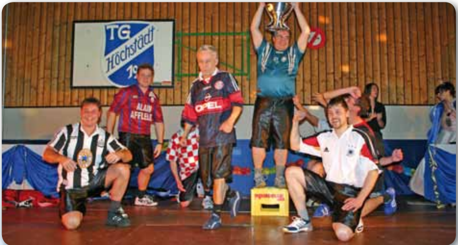
2007: Männerballett Schautanz