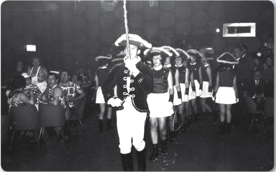
1967: Prinzengarde mit Tambourmajor