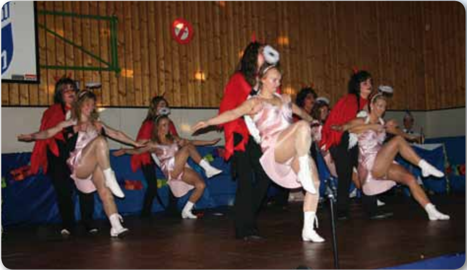
2007: Damenballett Schautanz