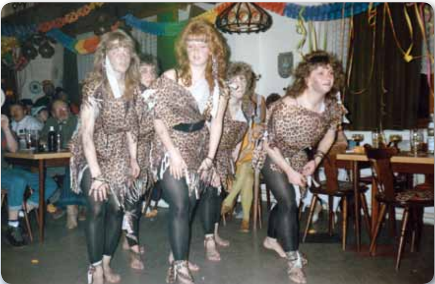
1989: Prinzengarde Schautanz KNOCK ON WOOD