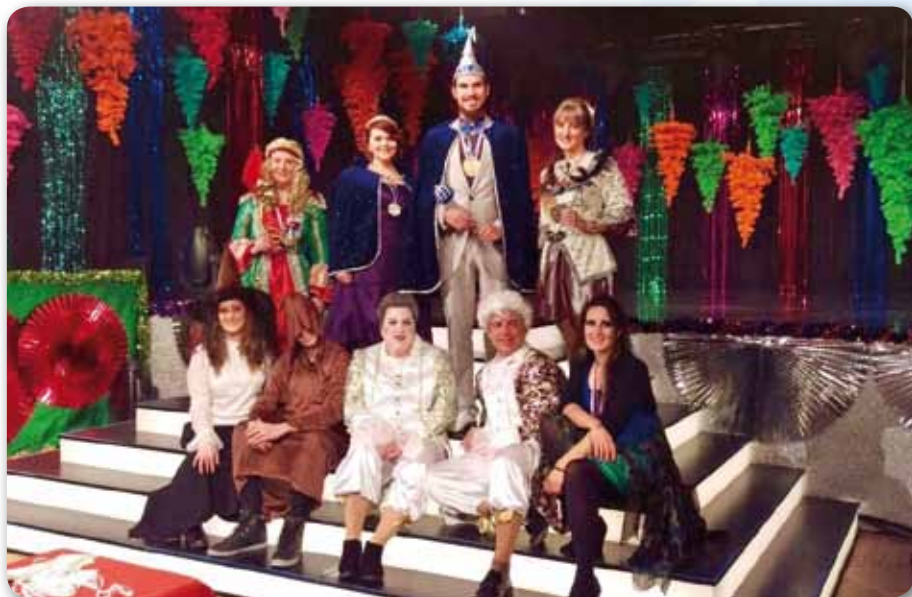
2017: Franken Helau in Marktredwitz