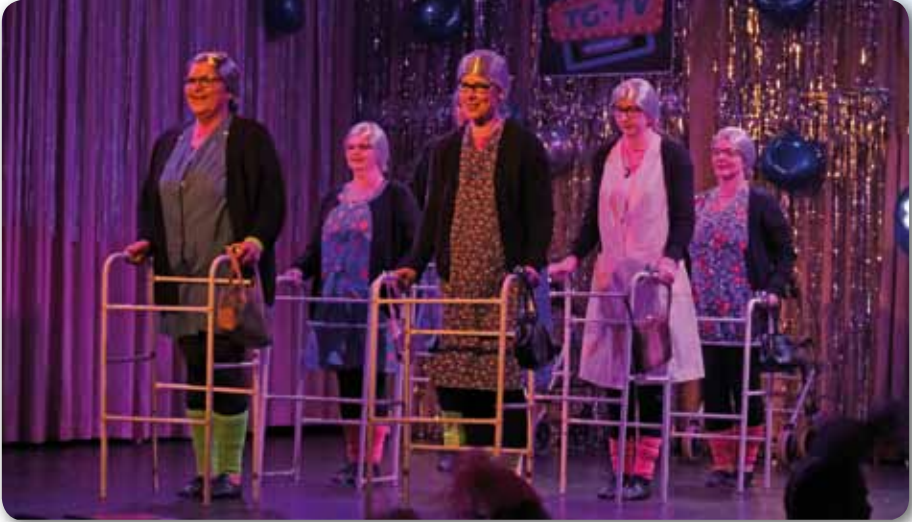
2023: Damenballett Schautanz