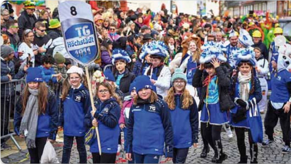
2020: TG Höchstädt beim Rawetzer Narrenzug