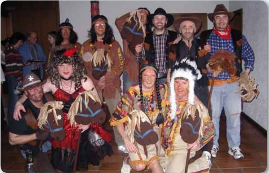
2006: Männerballett Schautanz