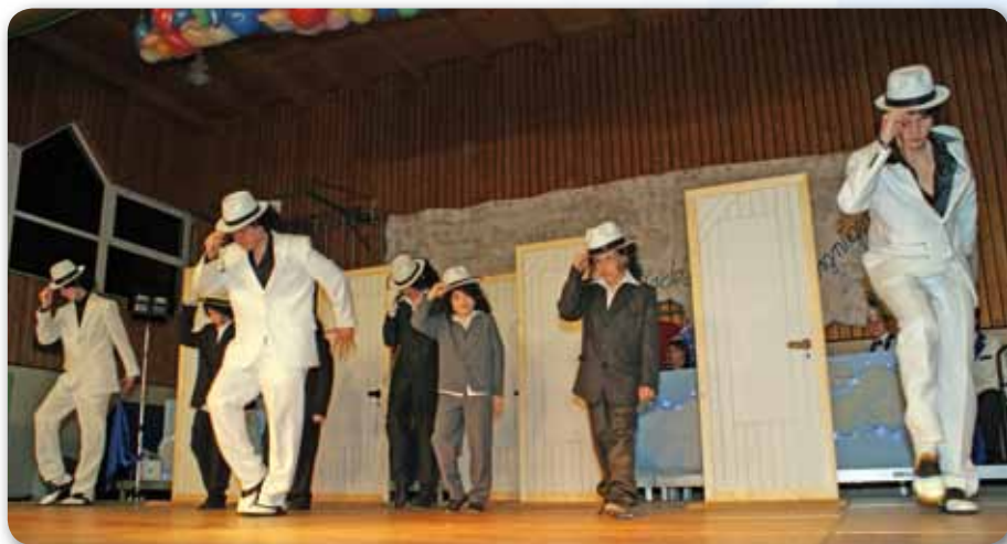
2010: Boy Group Schautanz