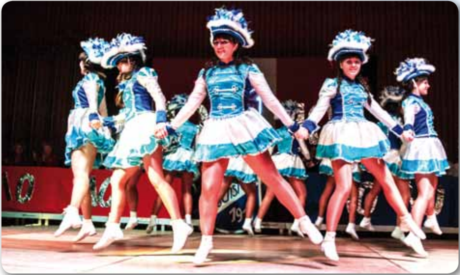
2016: Prinzengarde mit neuen Kostümen