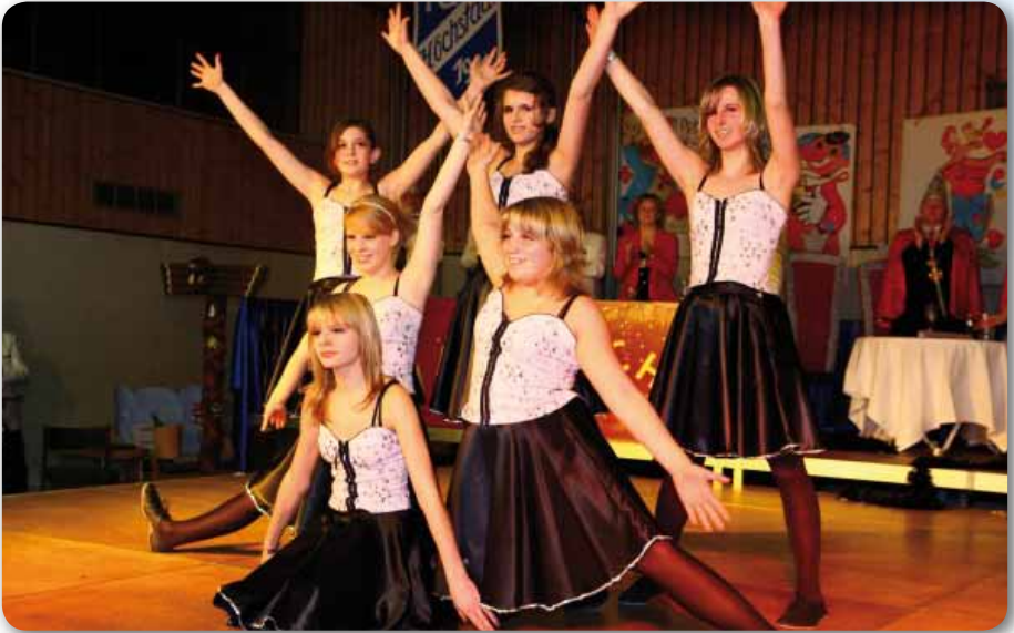
2009: Dance Kids III Schautanz