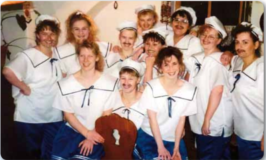
1994: Prinzengarde Schautanz GLASS OF CHAMPAGNE