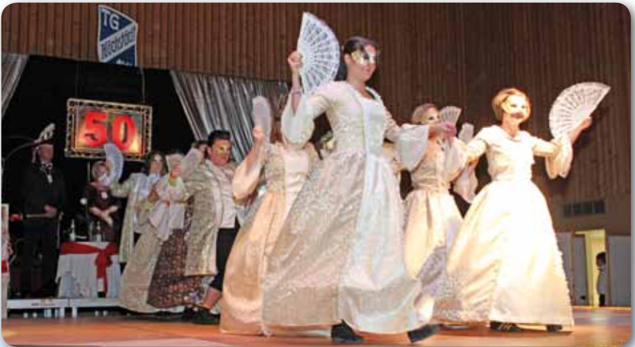
2014: Damenballett Schautanz