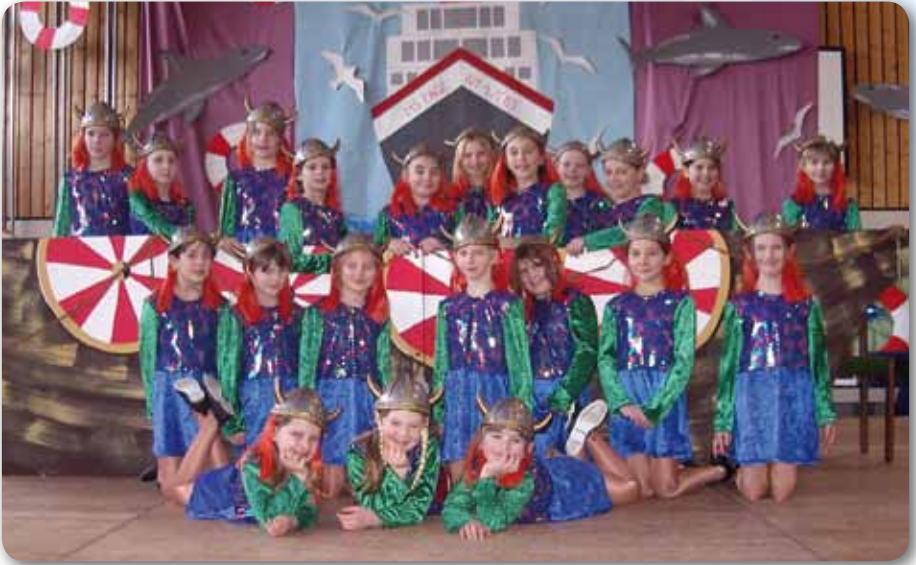
2006: Dance Kids I Schautanz WIKINGER