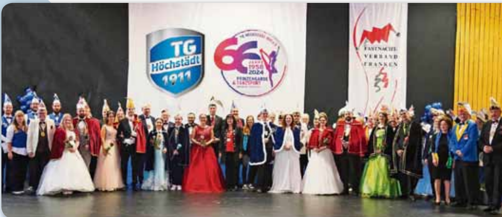
2023-11-05: Oberfränkische Faschingseröffnung in Höchstädt