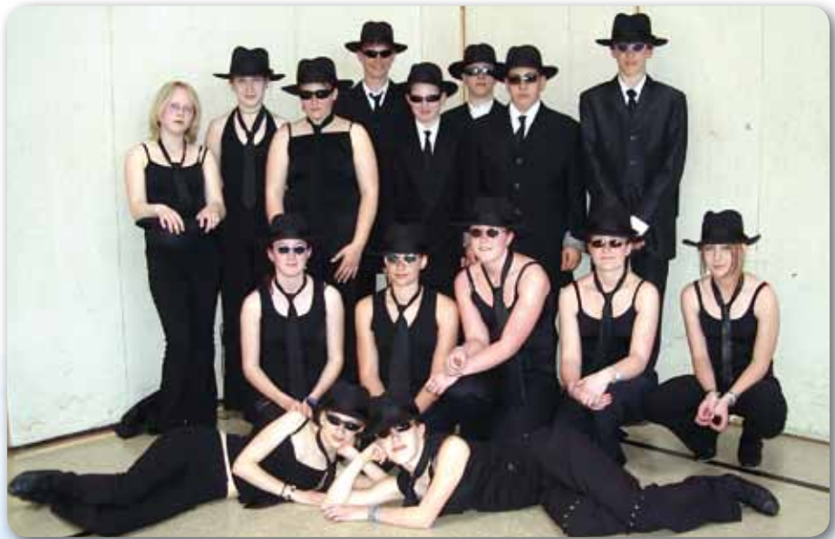
2004: Dance Kids III Blues Brothers