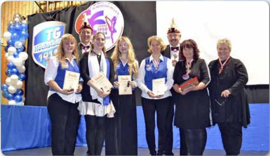
2003-11-04: Jubiläumsabend 66 Jahre Prinzengarde