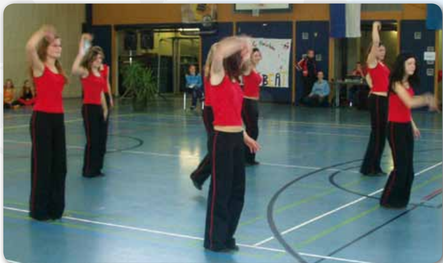
2004: Dance Devils beim Gruppenwettbewerb Dance