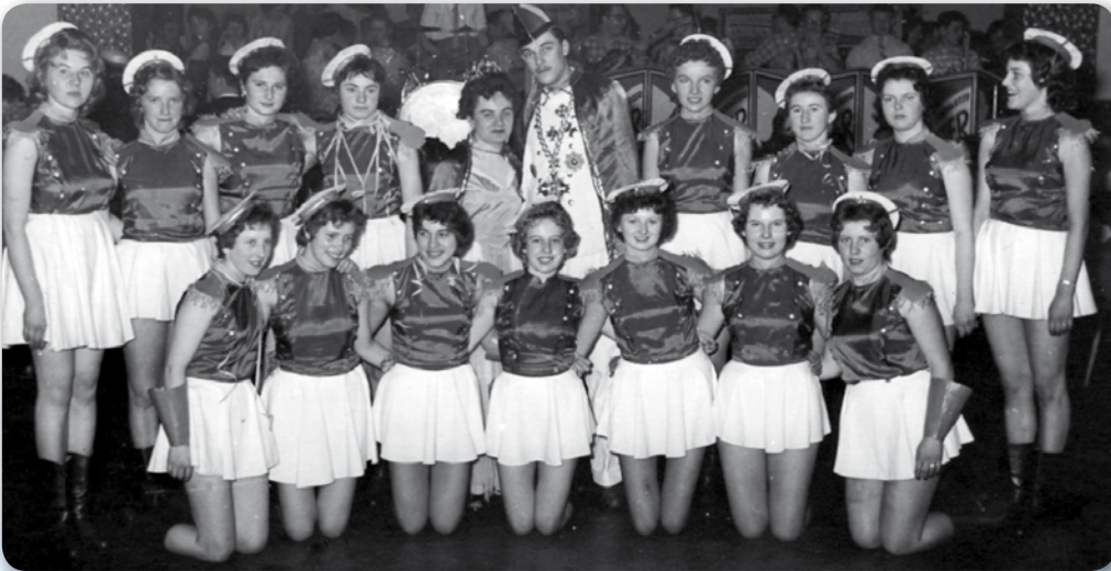
1. Prinzengarde 1958 mit Prinzenpaar