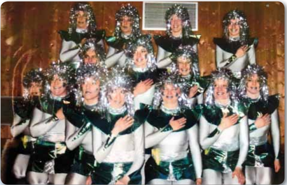
1997: Prinzengarde Schautanz MISSION IMPOSSIBLE