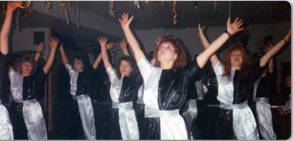
1991: Prinzengarde Schautanz HERO