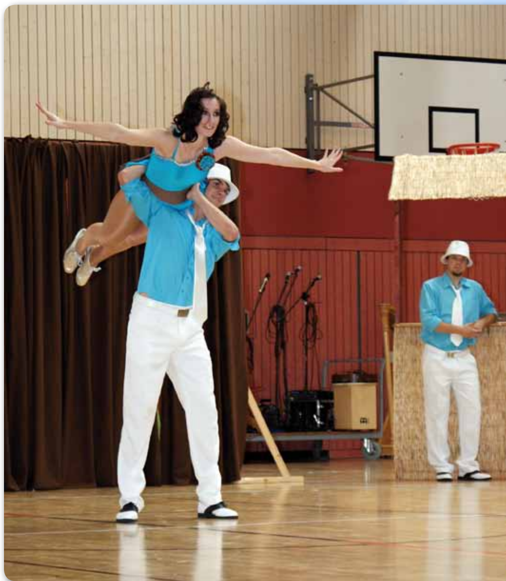
2010: Fire Dancer beim Rendezvous der Besten mit LA VIDA DE KUBA