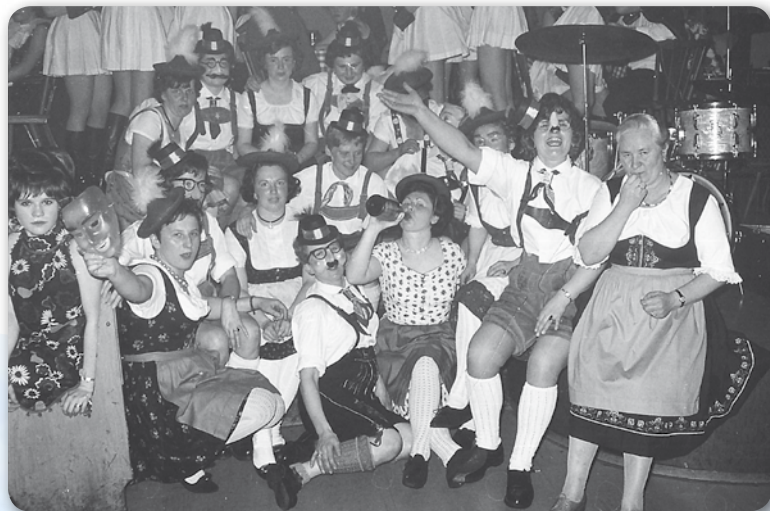
Zwischen 1954 und 1957: Almrausch