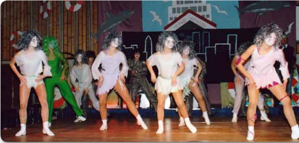
2006: Prinzengarde Schautanz GHOSTBUSTERS