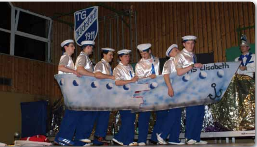
2011: Männerballett Schautanz