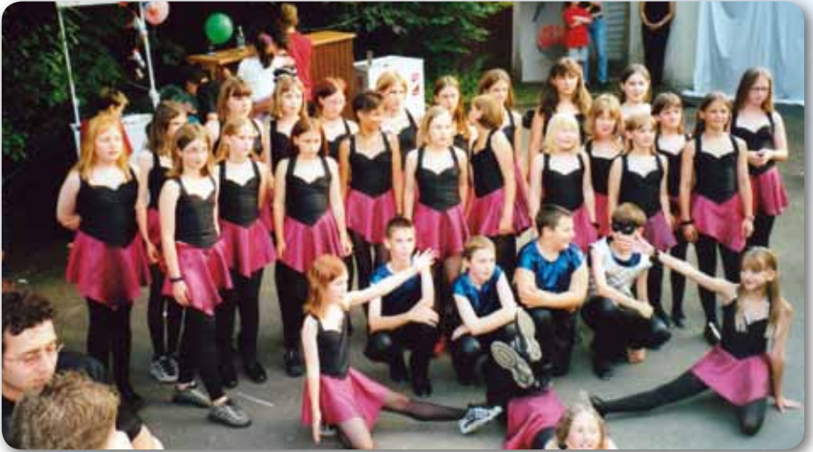
2001: Lord Of The Dance beim Irish Folkfestival in Höchstädt