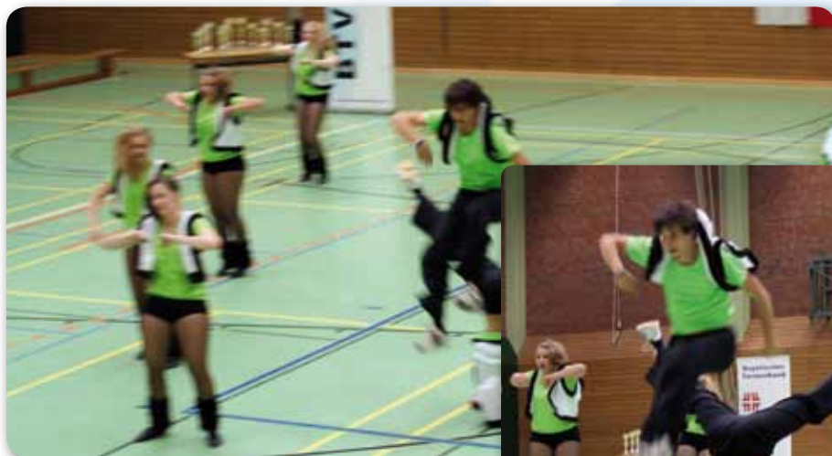
2011: Fire Dancer bei Dance2u STEP UP FD