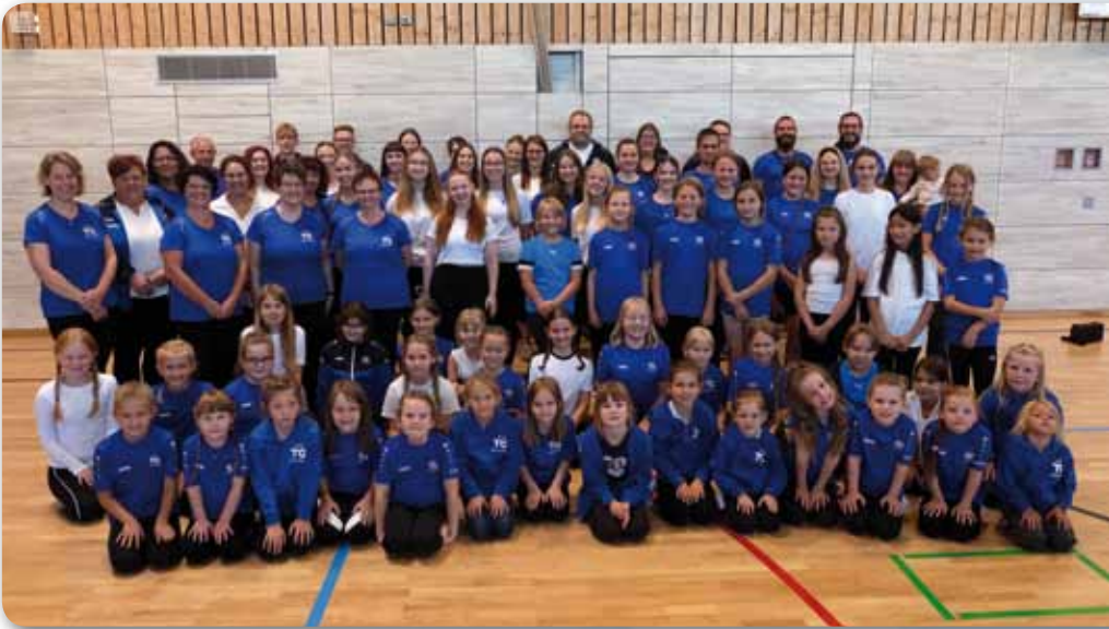
2023: Tanzsportabteilung der TG Höchstädt