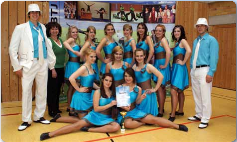
2009: Fire Dancer in Dorfen beim Wettbewerb Dance2u