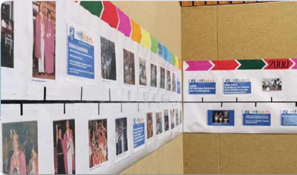
2023-11-04: Jubiläumsabend: Ausstellung alter Kostüme und Bilder