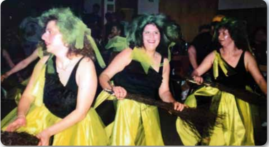
1993: Prinzengarde Schautanz DIE HEXEN