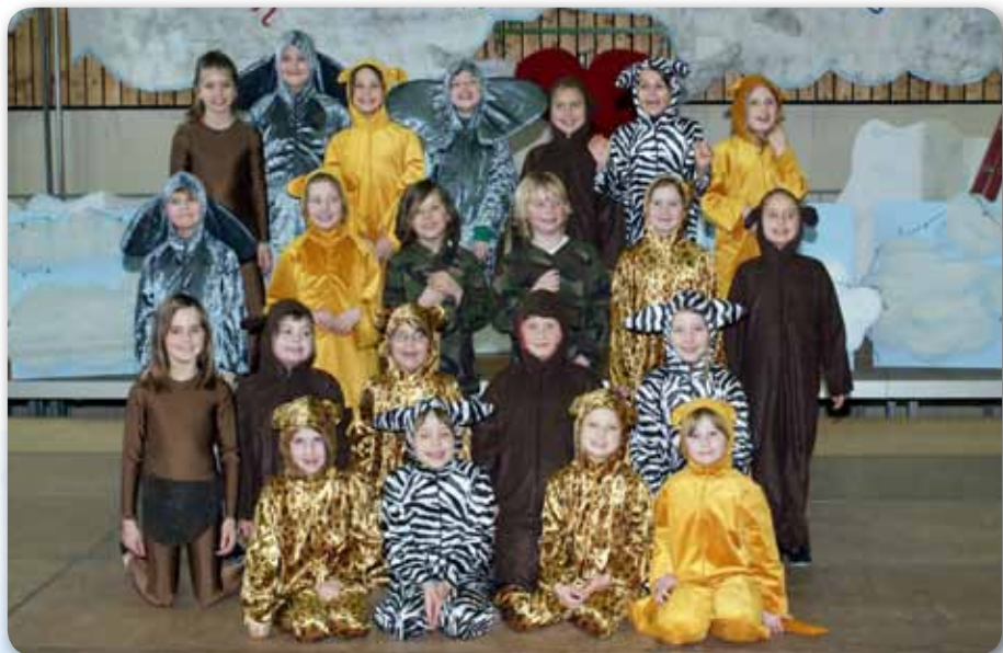
2010: Dance Kids | Schautanz DSCHUNGELFIEBER