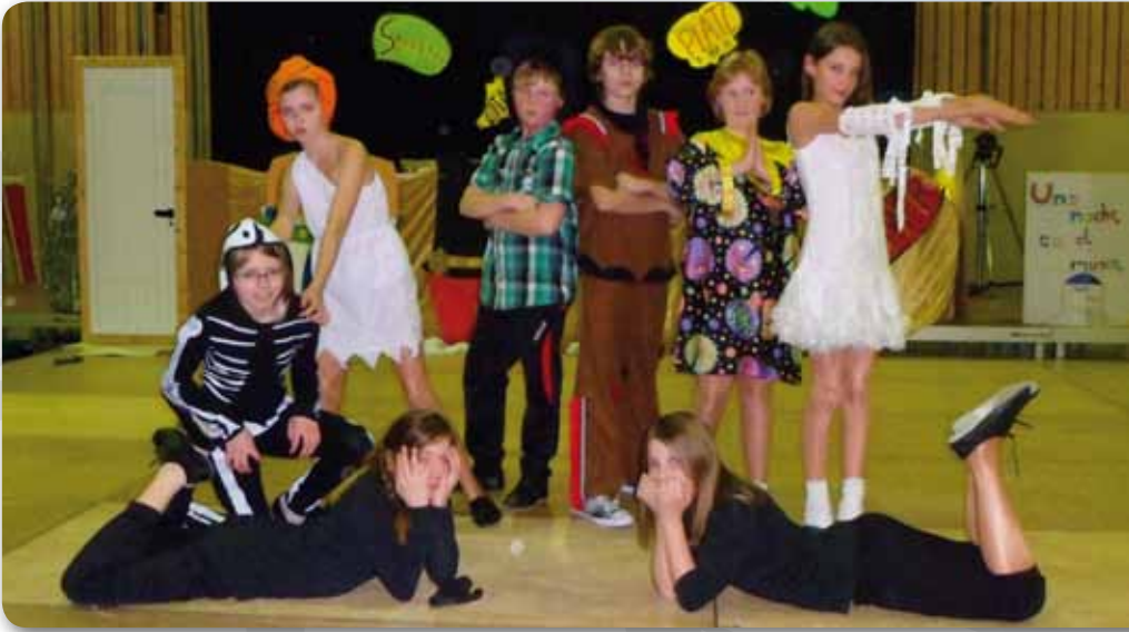
2013: Dance Kids II Schautanz