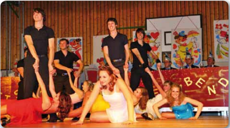
2009: Fire Dancer Schautanz DIRTY DANCING