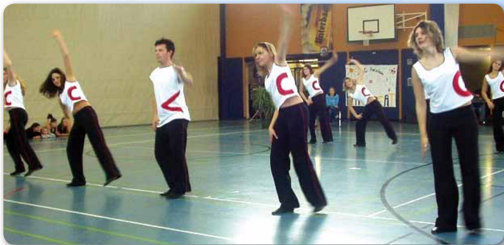
2004: Galaxy Dancer beim Gruppenwettbewerb Dance am Rain am Lech