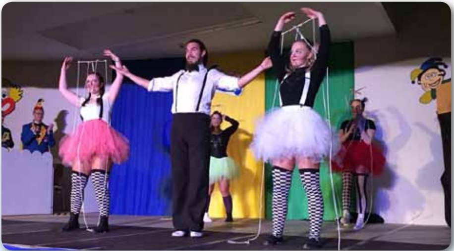
2018: Prinzengarde Schautanz DIE PUPPEN