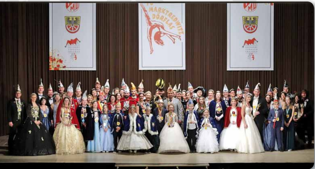
2023: Oberfränkisches Prinzentreffen bei der Faschingsgilde Marktredwitz Dörflas