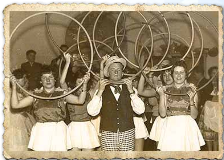
1959: Tanz Turnerball