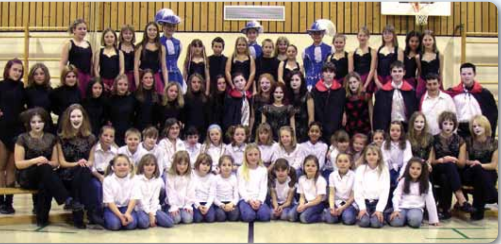
2004: Tanzabteilung mit Dance Kids I, II und III, Dance Devils und Prinzengarde