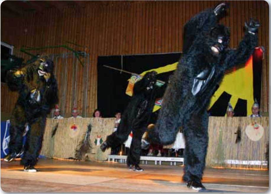
2015: Boy Group K'n'D