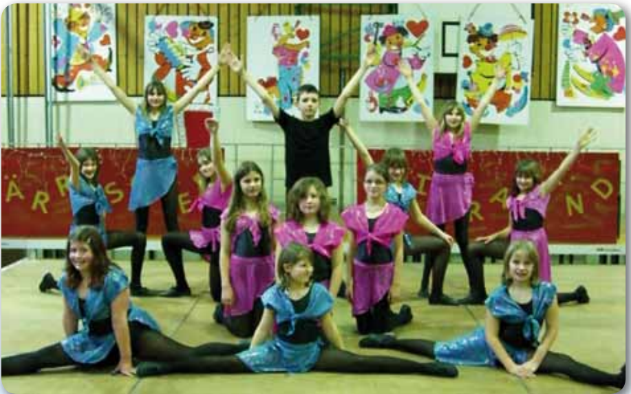
2009: Dance Kids II Schautanz