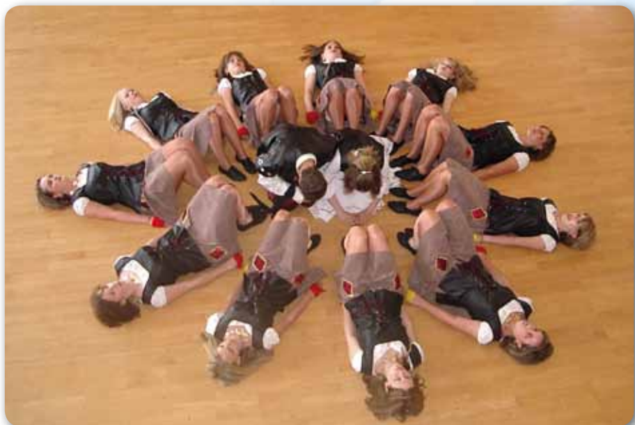
2006: Fire Dancer beim Landesfinale in Lauf mit dem FLUCH DER KARIBIK