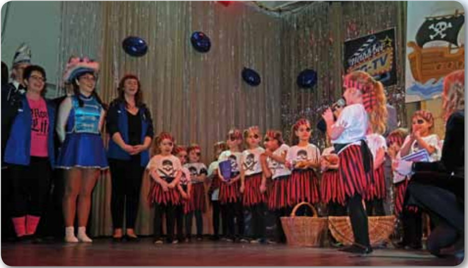
2023: Tanzmäuse Schautanz