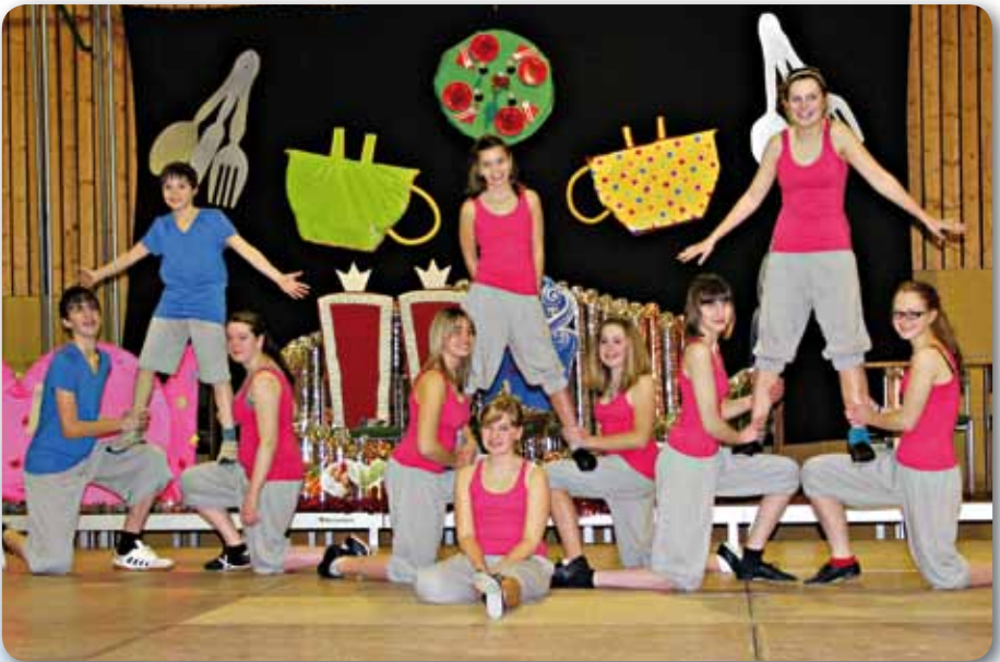
2012: Youse Dancer Schautanz