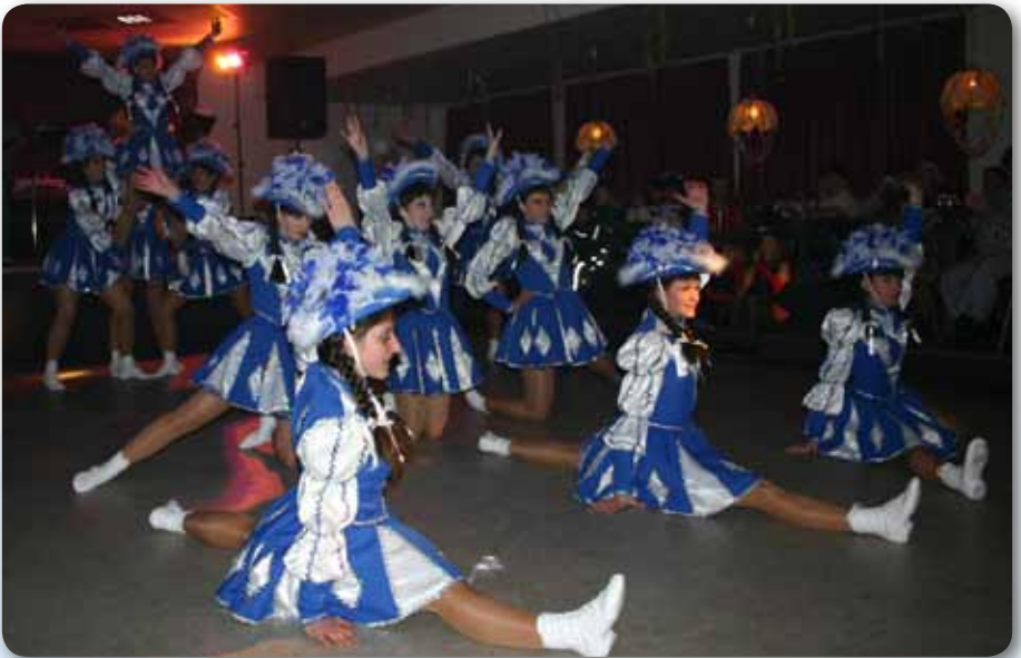
2005: Prinzengarde beim Turnerball der TG mit neuen Kostümen