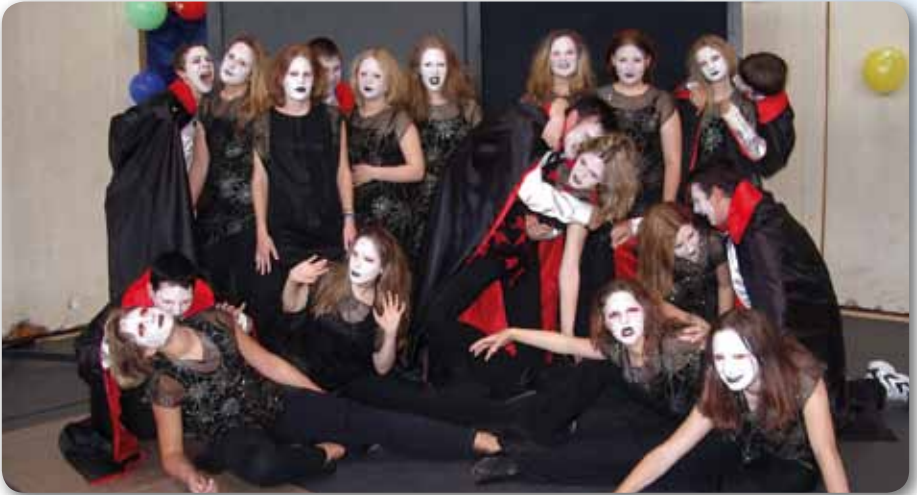
2004: Dance Kids III Tanz der Vampire