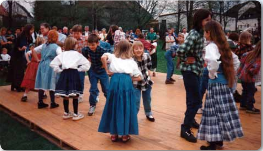
1998: Erster Auftritt der Dance Kids zum Maibaumaufstellen in Höchstädt Steirer Bluat