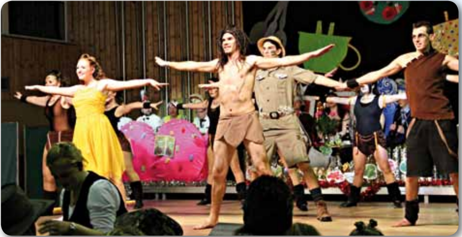
2012: Fire-Dancer-Garde Schautanz