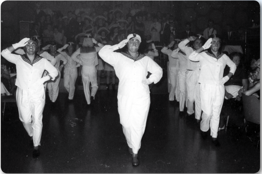
Zwischen 1954 und 1957: Matrosen