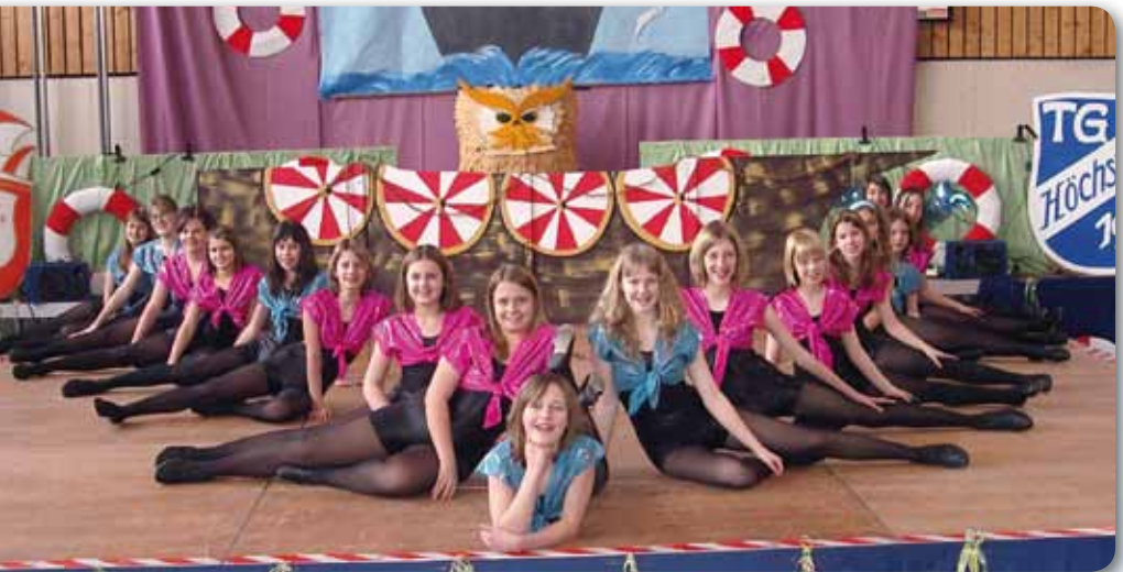
2006: Dance Kids II Schautanz