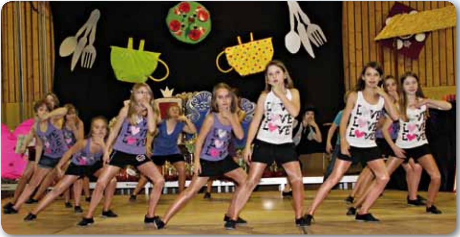
2012: Dance Kids II Schautanz