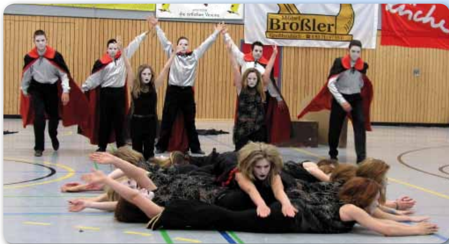
2004: Dance Kids III bei Showtime