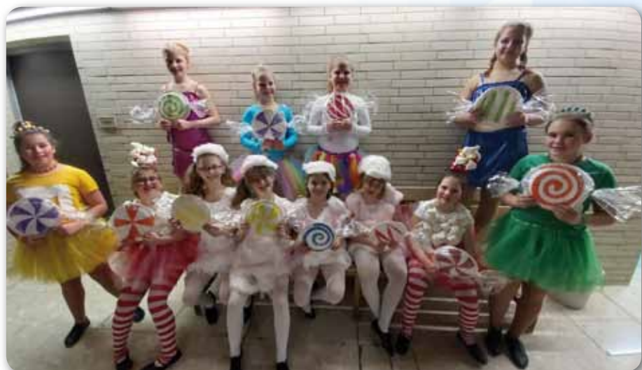
2020: Dance Kids Schautanz