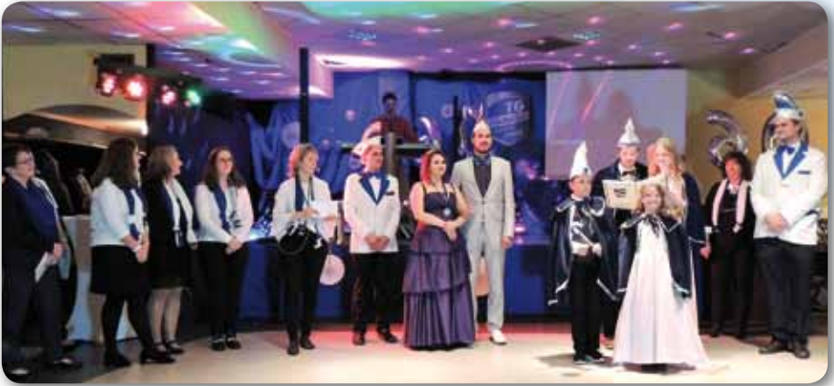
2018, November: Jubiläumsabend TG: 60 Jahre Prinzengarde und 20 Jahre Dance Kids