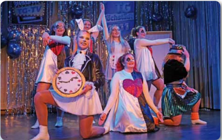
2023: Prinzengarde Schautanz ALICE IM WUNDERLAND