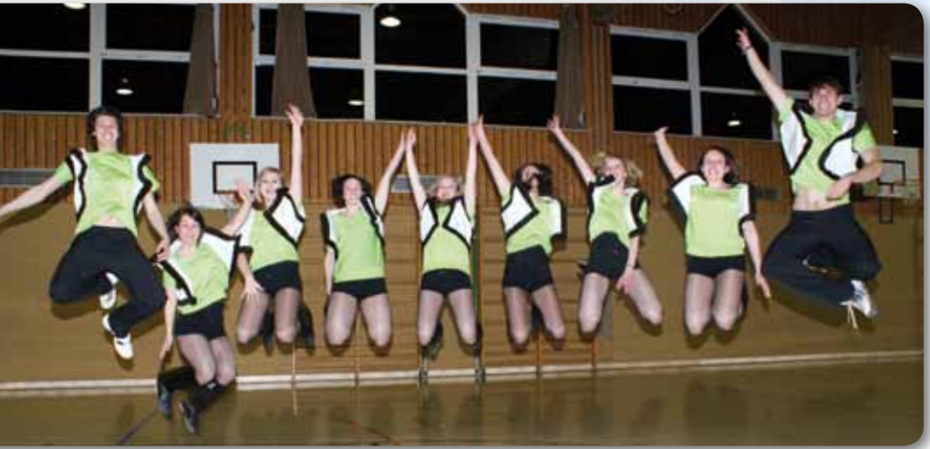
2011: Fire Dancer mit Vorfreude auf Galaabend