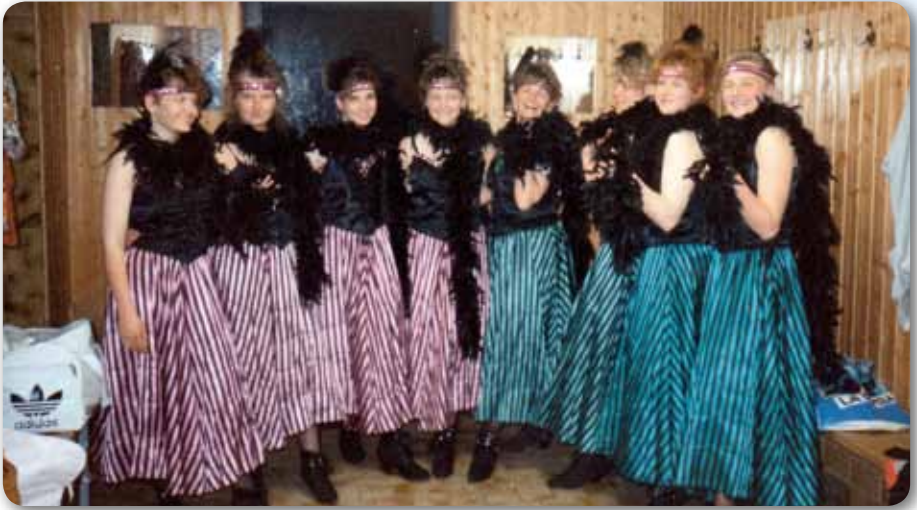
1990: Prinzengarde Schautanz CANCAN