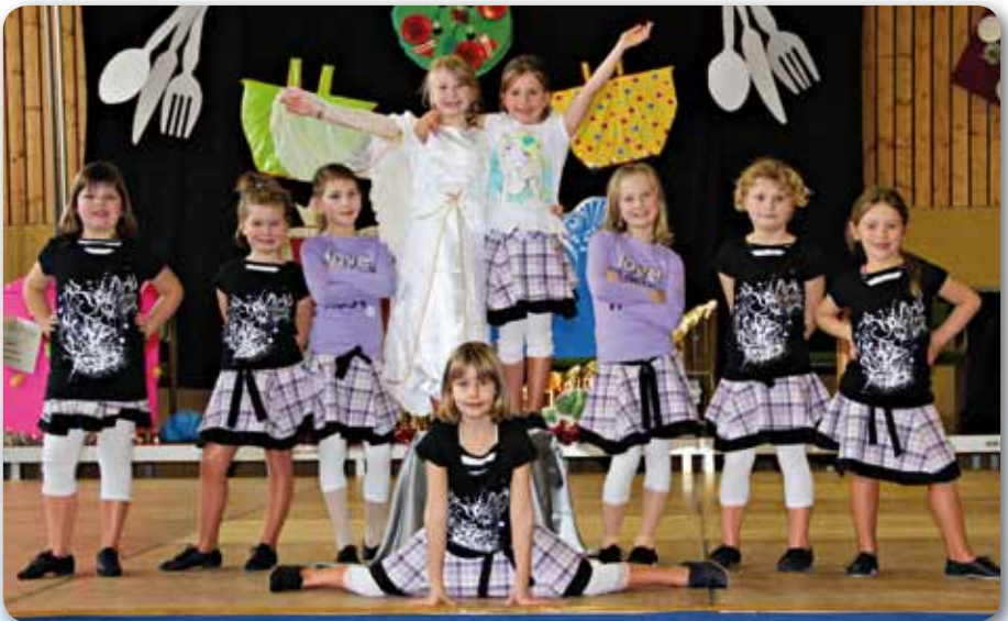
2012: Dance Kids I Schautanz