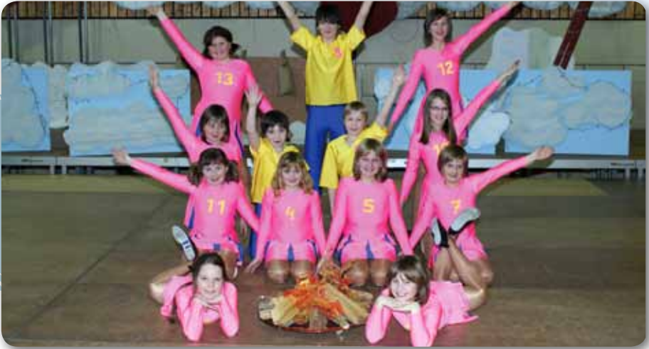
2010: Dance Kids II Schautanz CAMP CRAZY KIDS