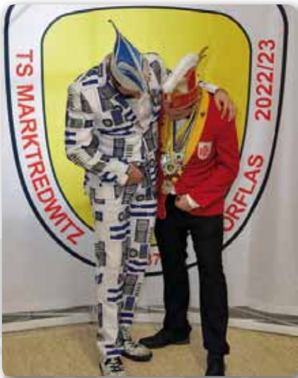
2023: Best Friends