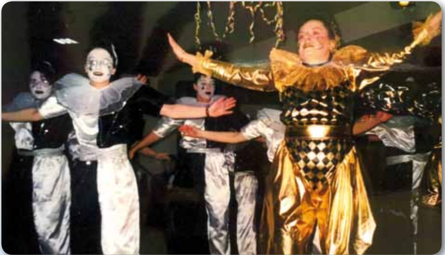
1998: Prinzengarde Schautanz HERE COMES THE CLOWN