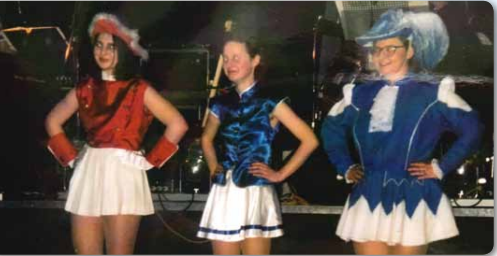
1998: Jubiläum 40 Jahre Prinzengarde TG Höchstädt beim Turnerball in der Bugatti-Bar