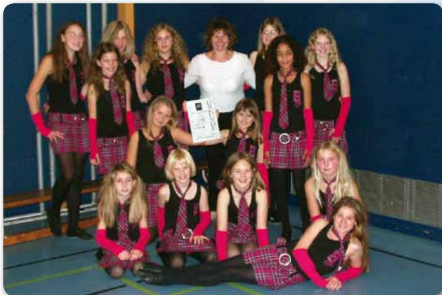
2004: Dance Kids II beim Gruppenwettbewerb Dance in Rain am Lech