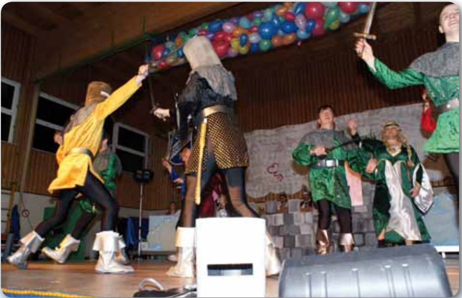
2010: Männerballett Schautanz