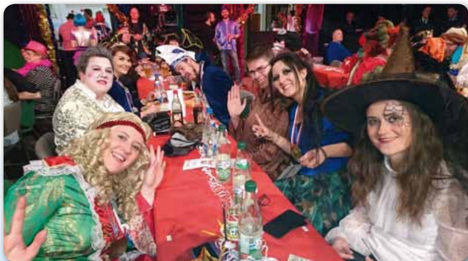
2017: Franken Helau in Marktredwitz