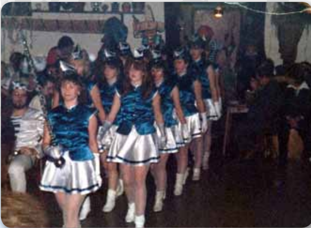
1986: Prinzengarde mit ersten blau-weißen Kostümen