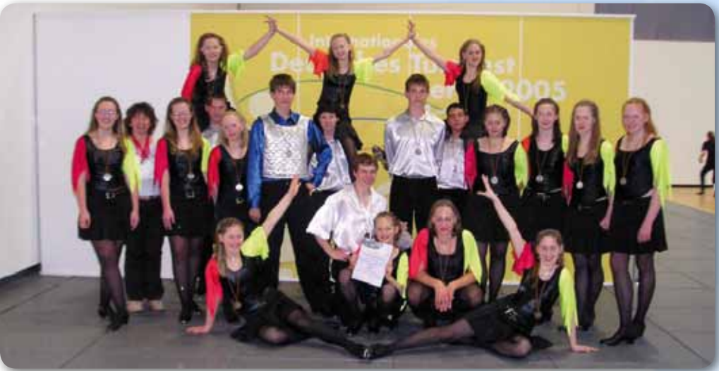
2005: Fire Dancer beim Intern. Deutsches Turnfest Berlin