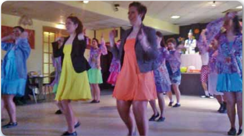
2014: Fire Dancer Schautanz Mamma Mia