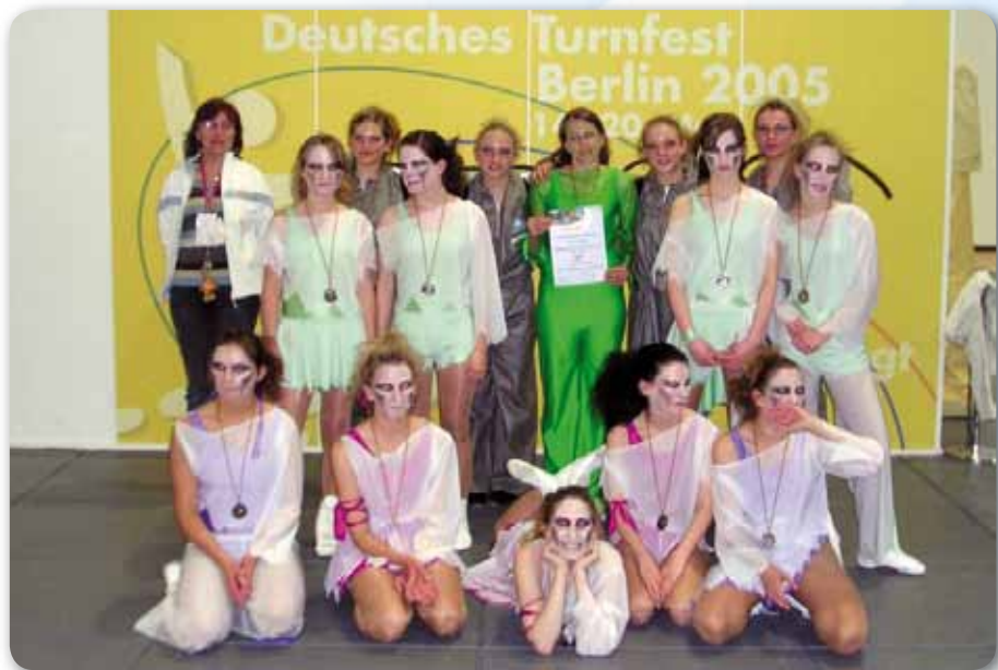
2005: Sweet Poison beim Intern. Deutsches Turnfest Berlin