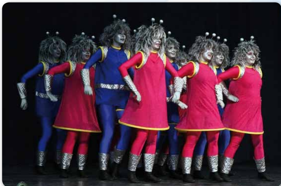
2009: Prinzengarde beim Oberfränkischen Tanzturnier DIE AUSSERIRDISCHEN