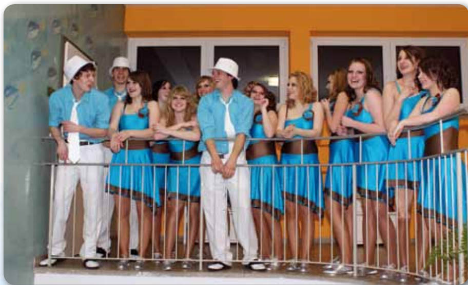
2010: Fire Dancer Schautanz