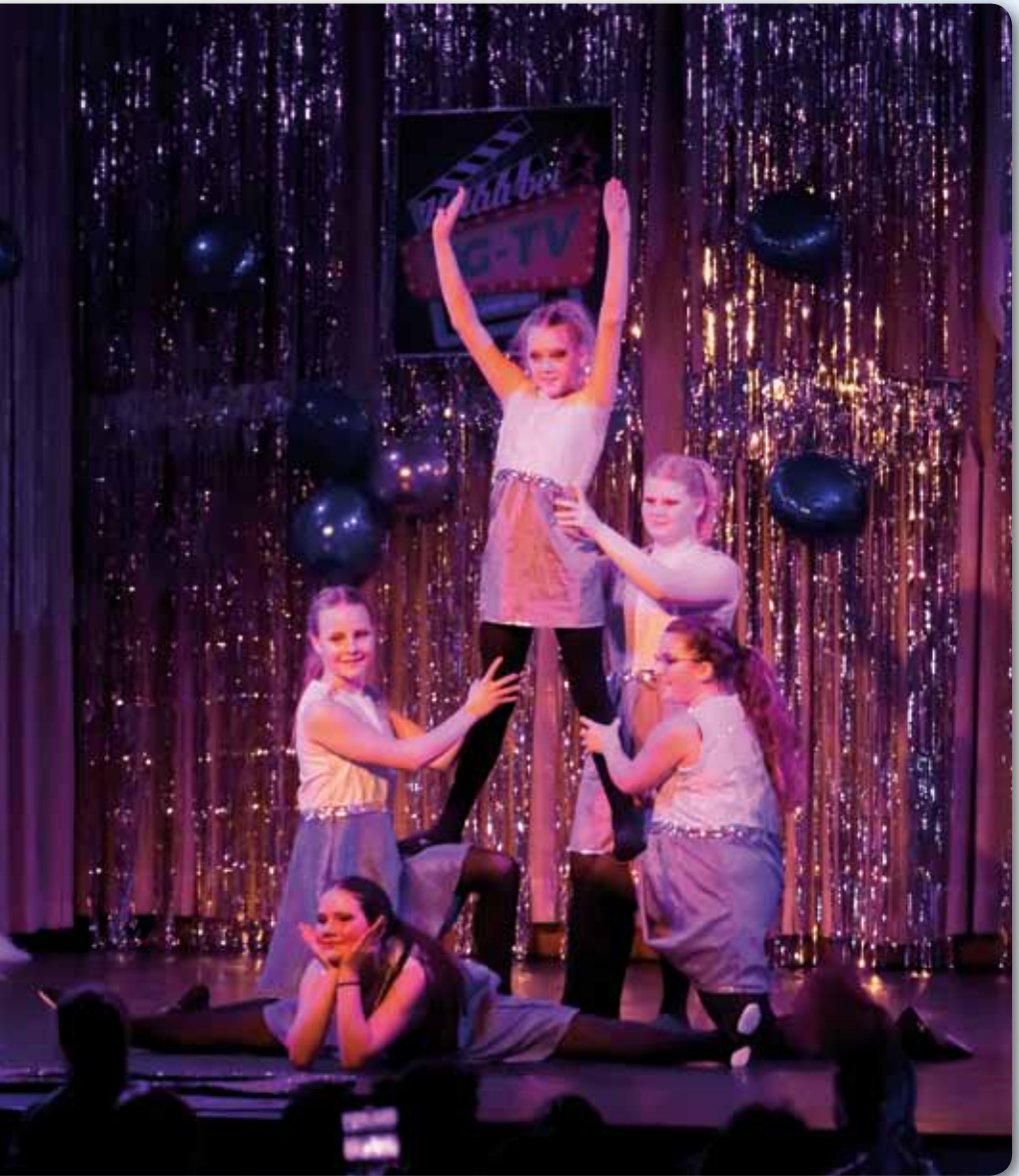
2023: Nachwuchsgarde Schautanz