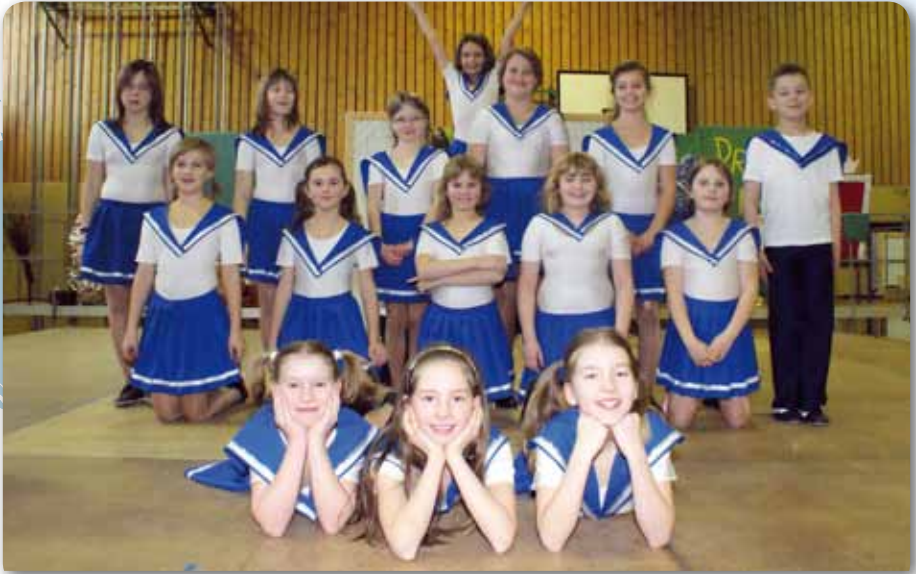
2011: Dance Kids II Schautanz