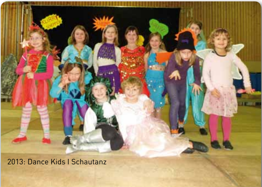
2013: Dance Kids | Schautanz