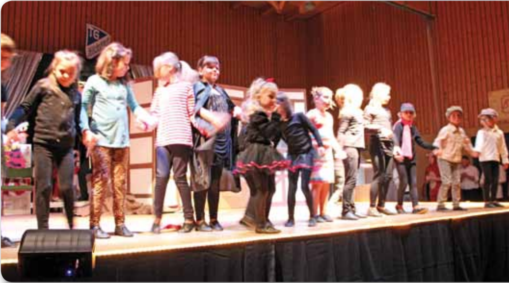
2014: Dance Kids | Schautanz