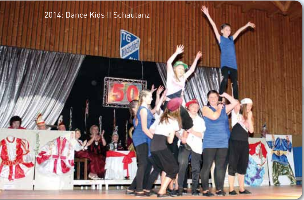
2014: Dance Kids II Schautanz