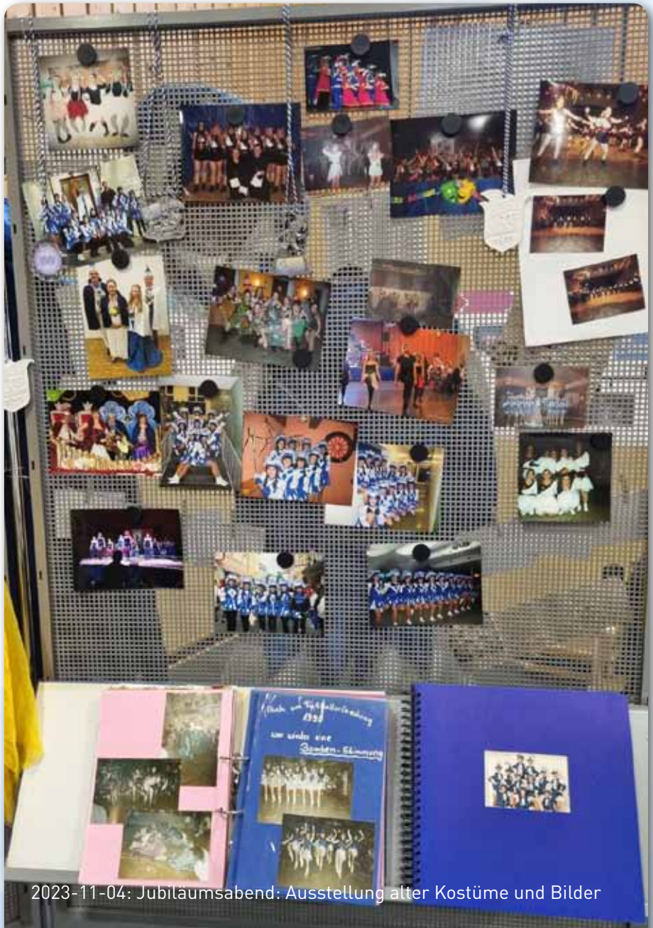
2023-11-04: Jubiläumsabend: Ausstellung alter Kostüme und Bilder