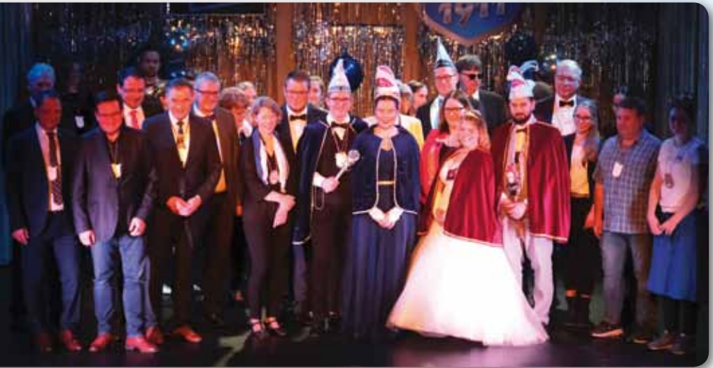
2023: Ehrungen beim Galaabend