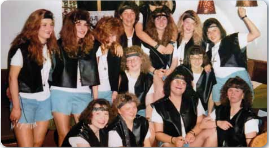
1995: Prinzengarde Schautanz ROCKIN' ALLOVER THE WORLD