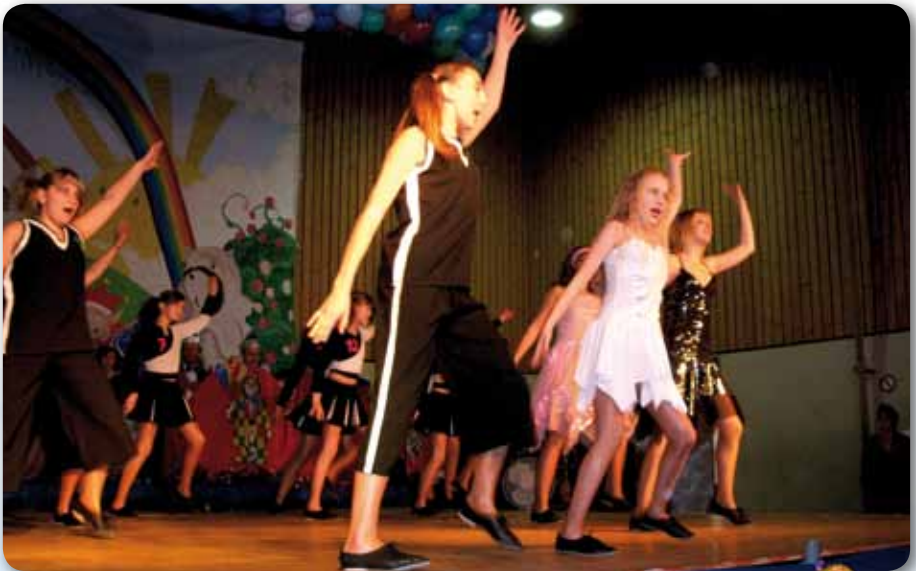
2008: Dance Kids III Schautanz