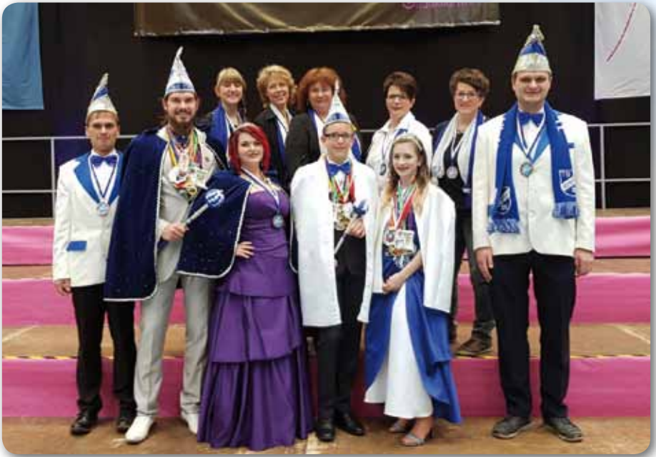
2018: Oberfränkisches Prinzentreffen in Mitterteich