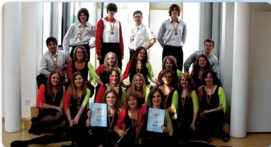
2006: Fire Dancer bei Showtime in Vöhringen mit FEET OF FLAMES