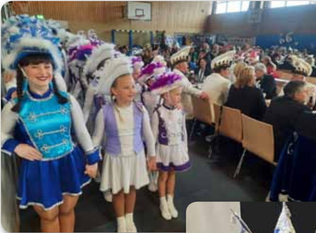
2023-11-05: Oberfränkische Faschingseröffnung: Jubiläumsgarde beim Einzug