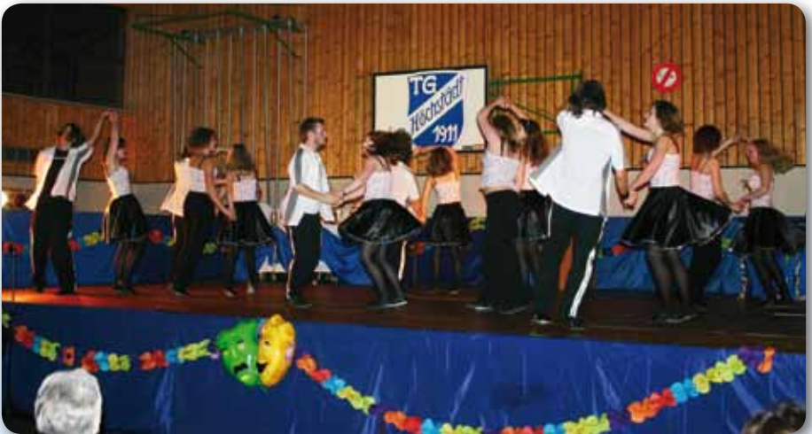
2007: Fire Dancer Schautanz FREESTYLER