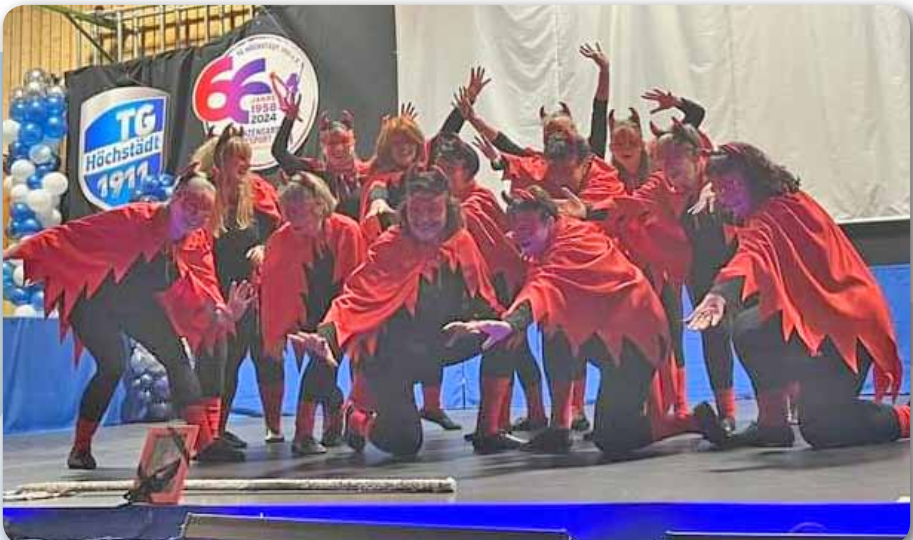
2003-11-04: Jubiläumsabend: Ehemalige Gardetänzerinnen mit dem Schautanz von 1988 „Dance With The Devil“