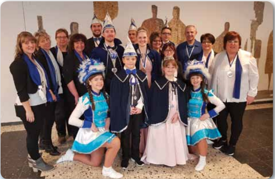
2019: Oberfränkisches Prinzentreffen in Steinwiesen