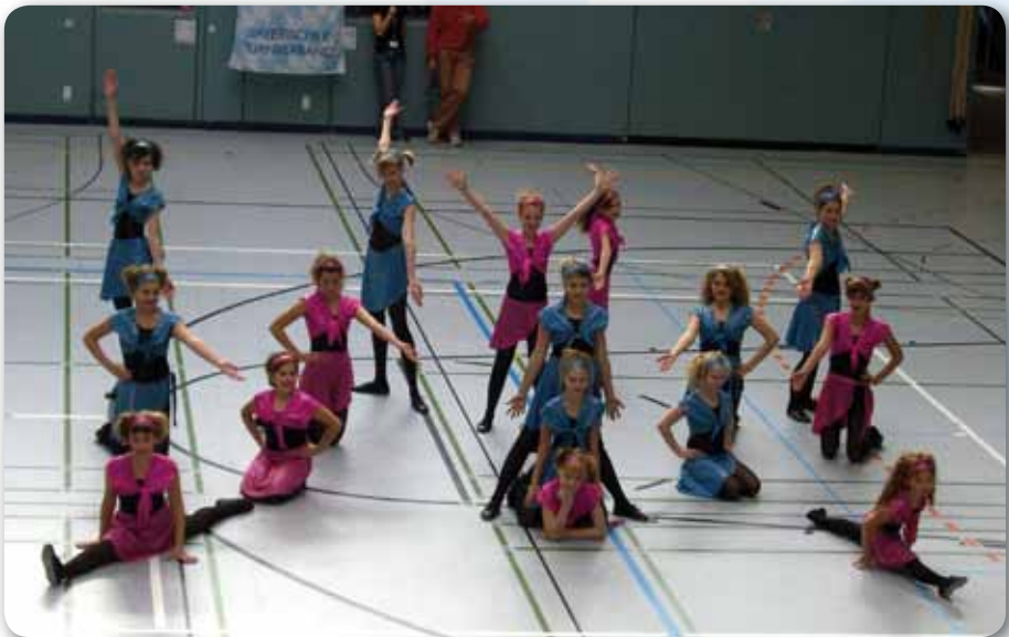
2006: Dance Kids II beim Gruppenwettbewerb Dance in Neusäß